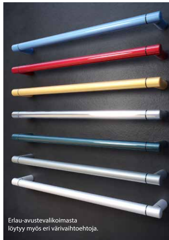
Erlau-avustevalikoimasta löytyy myös eri väri vaihtoehtoja.

Avusteiden tyylikäs muotoilu ja monipuoliset väri vaihtoehdot antavat sinulle mahdollisuuden luoda esteettömiä kylpyhuonekokonaisuuksia, jotka ovat myös tyylikkäitä ja kodinomaisia.